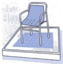
Préférer la douche Avec un siège adapté.