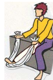
Se sécher les pieds avec une grande serviette ou un sèche-cheveux.